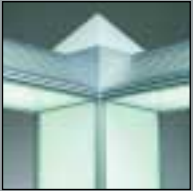
D 300 D 300