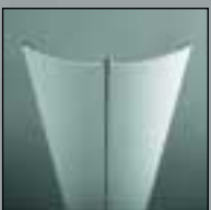
S 2300 S 2300