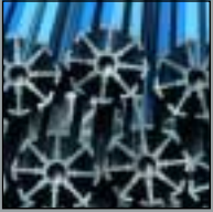
Messebausystem Exhibition System