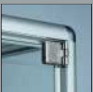
newline CORPUS newline CORPUS