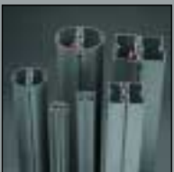
Maxima light Maxima light