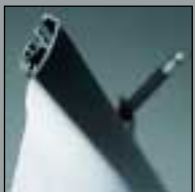
vario d5 vario d5