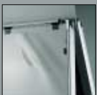
Kundenstopper und Rahmen Display Easels and Clip Frames

Die Kompetenz für kreative Systeme Expertise with Creative Systems