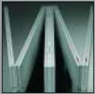
vario d1 vario d1