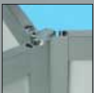
S 250 S 250