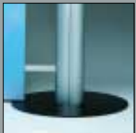
vario d2 vario d2