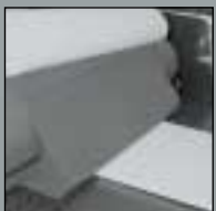
Display-Konfektionierung Display Fabrication